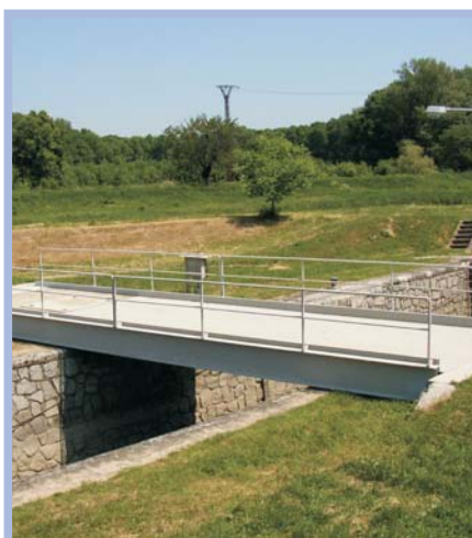
Otočný most přes plavební komoru Vnorovy II - 1999 ČESKÁ REPUBLIKA