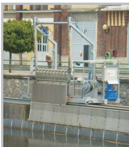
Čistící stroj česlí MVE Hučák - Hradec Králové - 2008 ČESKÁ REPUBLIKA