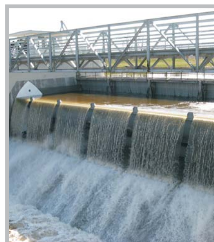
Jezové klapky České Vrbné - 2009 ČESKÁ REPUBLIKA

VODNÍ CESTY a.s. Na Pankráci 57 Praha 4, 140 00 Tel: 261 222 834 Fax: 261 223 492 www.vodnicesty.cz info@vodnicesty.cz