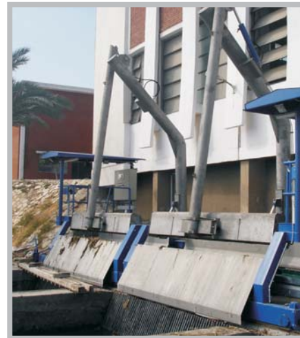
Čistící stroje česlí VD El Nasr a VD El Max - 2007 EGYPT