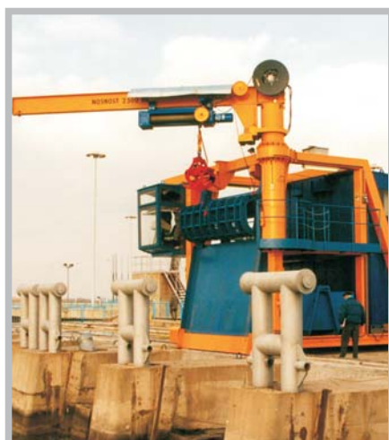
Lanový čistící stroj VD Gabčíkovo - 1999 SLOVENSKO