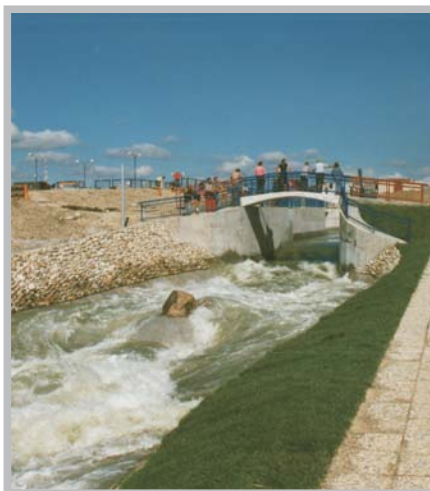
Pohyblivé uzávěry - dráha pro vodní sporty Čunovo - 1996 SLOVENSKO