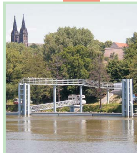
Čekací stání lodí v ochranném přístavu Praha - Smíchov 2003 ČESKÁ REPUBLIKA