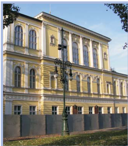
Protipovodňové membránové hrazení Praha - Palác Žofín - 2005 ČESKÁ REPUBLIKA