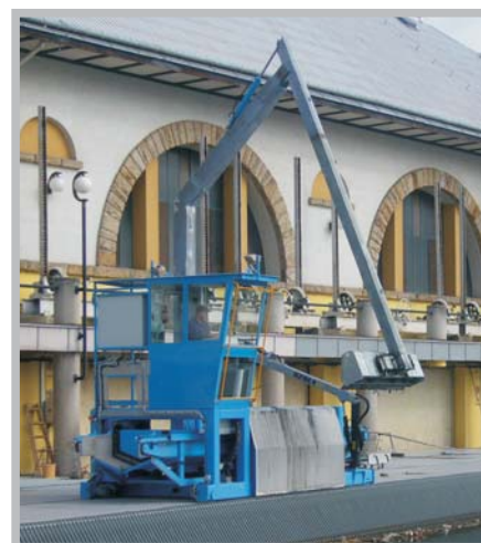
Čistící stroj česlí MVE Měřevojice - 2009 ČESKÁ REPUBLIKA