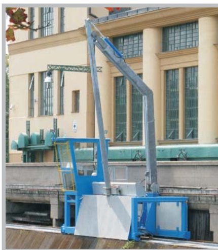
Čistící stroj česlí MVE Nymburk - 2009 ČESKÁ REPUBLIKA

Klapkový uzávěr VD Přelouč Klapky pro horní zhlaví PK Gabčíkovo Jezové klapky na Veličce a na Dřevnici Kotvení stání pro servisní loď v Praze Čekací stání lodí na Labi Otočný most v Uherském Ostrohu Čistící stroje MVE Předměřice a Spytihněv Stavidla MVE v Makedonii