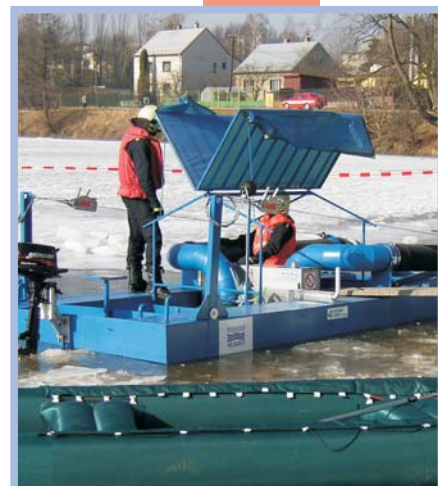
Čerpací prám 2003 ČESKÁ REPUBLIKA