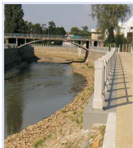
Úprava koryta řeky Moravy Veselí nad Moravou - 2003 ČESKÁ REPUBLIKA