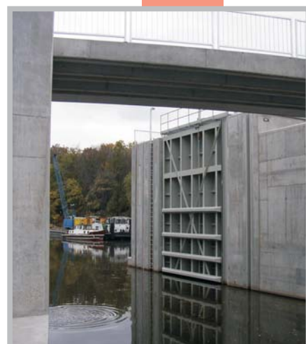
Vzpěrná vrata Přístav Praha - Libeň - 2005 ČESKÁ REPUBLIKA